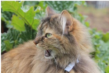
Katt 1 f/5.6, 1/125, ISO 100, 72mm

Først må jeg bare si at det første bildet (blomst 1) har jeg tatt med litt for å vise at det ikke alltid blir som tenkt. Da jeg tok bildet, fokuserte jeg på de blå blomstene og så at bladene ble ufokusert. Det jeg så i ettertid, var at det ikke ble så godt fokus i bildet som jeg trodde, og fokus ble på en kvist oppe i midten, et ikke så veldig interessant «hovedmotiv». Det er spennende å se hvor mange ulike fokus det kan være i ett og samme bilde, selv om det ble litt bom akkurat her. Det andre bildet (blomst 2) ble litt bedre, og mer sånn jeg ville ha det. Jeg synes det er blomstene som er mest interessante som motiv og fokus. Kvisten oppe mot venstre er ganske tydelig og «bryter» litt med blomstene, men jeg synes egentlig det er litt fint, for det gir litt mer liv i bildet siden det bryter litt med blomstene.