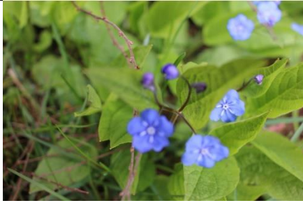
Blomst 1 f/4, 1/60, ISO 100, 24 mm