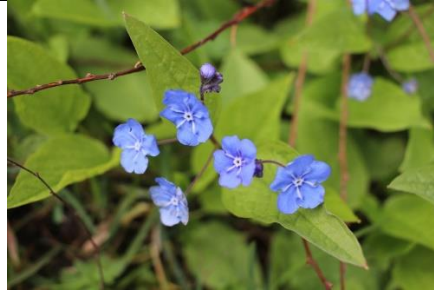
Blomst 2 f/4, 1/80, ISO 100, 24 mm

Først må jeg bare si at det første bildet (blomst 1) har jeg tatt med litt for å vise at det ikke alltid blir som tenkt. Da jeg tok bildet, fokuserte jeg på de blå blomstene og så at bladene ble ufokusert. Det jeg så i ettertid, var at det ikke ble så godt fokus i bildet som jeg trodde, og fokus ble på en kvist oppe i midten, et ikke så veldig interessant «hovedmotiv». Det er spennende å se hvor mange ulike fokus det kan være i ett og samme bilde, selv om det ble litt bom akkurat her. Det andre bildet (blomst 2) ble litt bedre, og mer sånn jeg ville ha det. Jeg synes det er blomstene som er mest interessante som motiv og fokus. Kvisten oppe mot venstre er ganske tydelig og «bryter» litt med blomstene, men jeg synes egentlig det er litt fint, for det gir litt mer liv i bildet siden det bryter litt med blomstene.