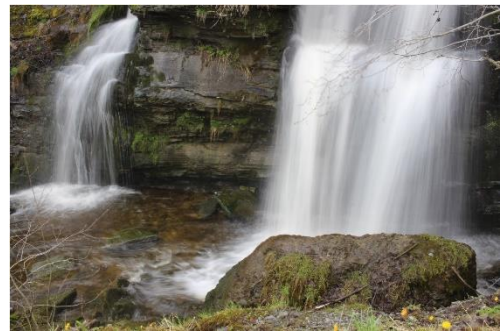
Foss 4 f/20, \frac{1}{4} , ISO 100, 24 mm

Bildet «foss 3» viser et av bildene jeg er minst fornøyd med, utsnittet er ok, men det blir alt for lyst, og det ser nesten litt unaturlig ut, det er ikke så mye bevegelse i fossen til høyre. Foss 4 ble min favoritt, vannet ser sløraktig og «mykt» ut, berg og stein er skarpe, mørke og tydelig i fokus og blir en kontrast til det myke sløret. Vannet ser ganske levende ut siden det både er lyse og mørke partier. Der fossen treffer bekken, ser det nesten ut som skum i vannet.