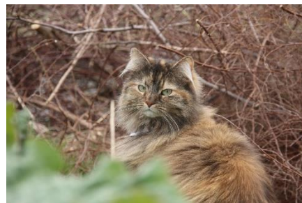
Katt 2 f/5.6, 1/100, ISO 100, 125 mm

Katta kom bort, og jeg satte på ganske lav blender. Nå hadde jeg linse med zoom, og jeg fikk ikke til å ta ned blender like mye når jeg zoomet noe inn. De faste objektiven tillater lavere blendertall når jeg er nært. Heldigvis var det godt lys, men det blir noe mer detaljer i bakgrunnen enn det jeg hadde ønsket. Det er litt vanskelig å få tatt gode bilder av katta. Det første bildet (katt 1) er ganske bra på øynene, men munnen er litt uskarp. Det beste hadde vært om hun var vendt litt mer mot meg, men hun var ikke så veldig interessert i å samarbeide. Det siste bildet (katt 2) synes jeg er ganske fint, det har tre lag. I forgrunnen er det et lag med ganske blurry rabarbrablader. Katta, som er hovedmotiv, er ganske skarp i midten i det andre laget, og det siste laget er kvisthaugen bak katta. Den synes jeg er litt for dominerende, og siden katta er naturfarget, forsvinner hun litt. Jeg vil se om jeg kan gjøre noe med dette i Photoshop neste uke.