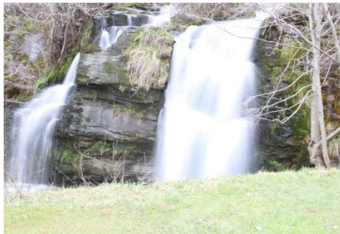
Foss 3 f/22, 1 sek, ISO 100, 24 mm

Etterpå ville jeg få til sløreffekt, da måtte jeg bruke stativ og lang lukketid. Det var nesten magisk å se noen av bildene når lukketiden var lang (hvis det var ett sekund eller mer ble det for lyst, overeksponert. Noen av de fineste bildene hadde \frac{1}{4} i lukkertid). Jeg må innrømme at jeg knipset i vei uten helt å vite hvordan det skulle bli, men prøvde å justere lukkertiden litt og litt for å se hvordan fossen ble seende ut. Enkelte bilder ble veldig fine.