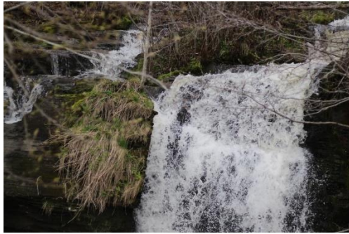
Foss1 f/1.8, 1/1000, ISO 100, 50 mm