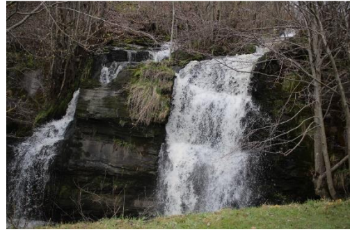
Foss 2 f/2.8, 1/320, ISO 100, 24 mm

På fossbilde 1 og 2 har jeg kort lukketid, og det fanger dråpene i en slags frys, det ser litt «hardt» og kaldt ut. 50 mm er en god del nærmere enn 24 mm. Jeg brukte derfor 24 mm mest for å fange mer av fossen og få et større utsnitt.